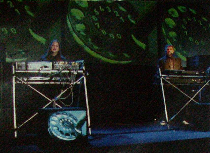
Früher „[redacted]“-Mann, jetzt solo in Wolfsburg: Karl Bartos (r.)